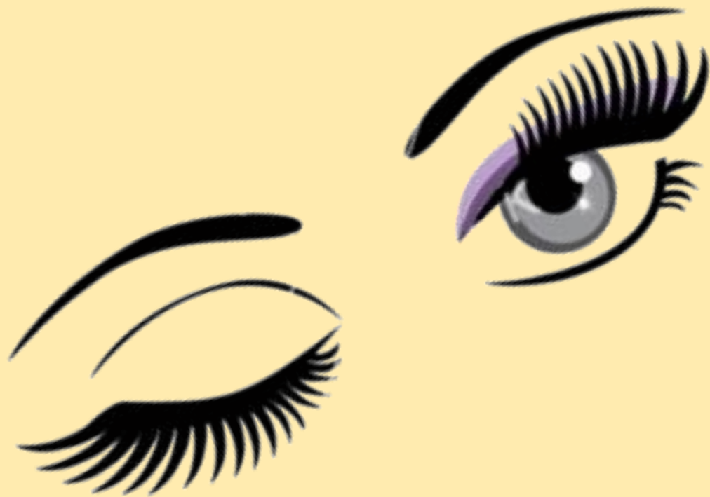
Схема-памятка по этапам процедуры лифтинга ресниц